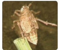
2~3일 후 물위로 떨어져 죽음