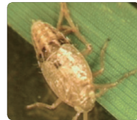
15분~ 20분 후 정상적인 활동 불가