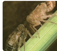
약제 처리 직전 구침을 박고 매달려 있음